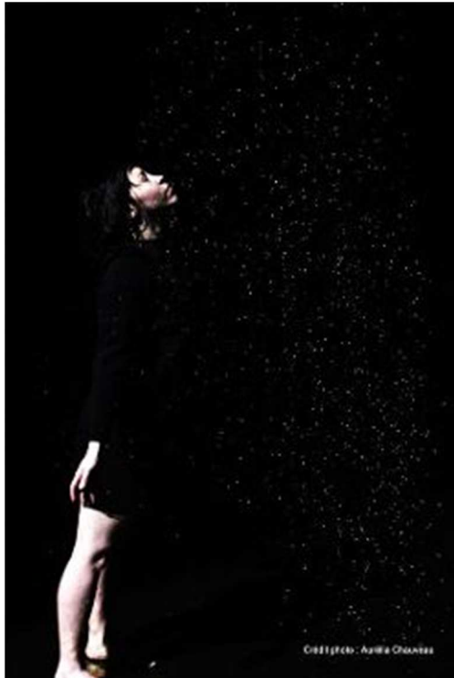
7 M 2 au Caméléon

Accueillie par la Ville de Pont-du-Château dans le cadre de sa saison culturelle, la compagnie de théâtre Le Pied en dedans, a présenté sa dernière création « 7 m 2 », spectacle de danse et arts visuels pour jeune public.