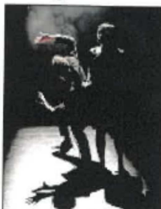
Une pure merveille.

À travers un nuage de fumée, une incroyable fantasmagorie naît d'une scénographie minimaliste et pour autant fabuleuse. Une succession de tableaux, inspirés du conte Hansel et Gretel , une musique mystérieuse, évoquant la matière ou la nature, clapotements, bruits de bouche ou crépitements, le sablier du temps qui fuit dans une pluie de paillettes d'or, nous emmènent vers un voyage