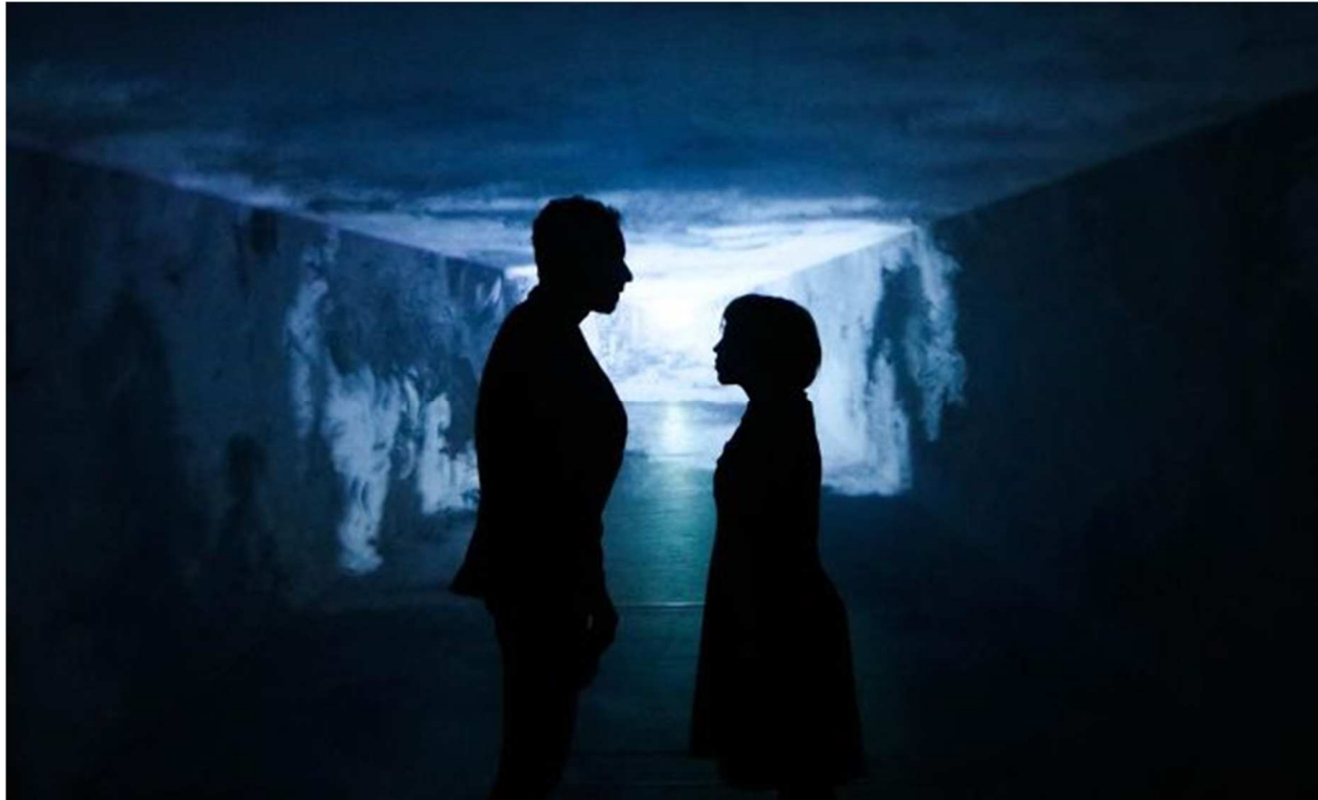
La liberté au bout du tunnel pour les deux enfants.

Vendredi, après une semaine de résidence au théâtre de Cusset, la compagnie Le Pied en Dedans a donné en avant-première deux extraits de son nouveau spectacle 7 mètres Carrés, devant une quarantaine de personnes.